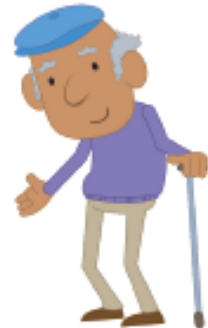
el abuelo grandpa