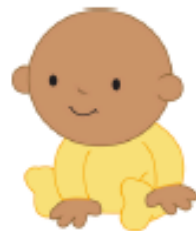
el primo/ la prima cousin