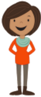
la mamá mom