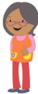
la abuela grandma