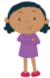
la hija/ hermana daughter/sister