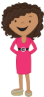
la tía aunt