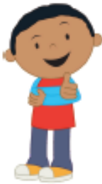
el hijo/ hermano son/brother